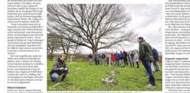
De jaarlijkse mededeling van de Wetenschappelijke Klimaatraad aan de Tweede Kamer, 15 december 2023